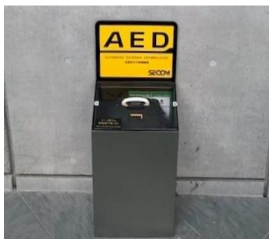
AEDの設置（設置場所確認）