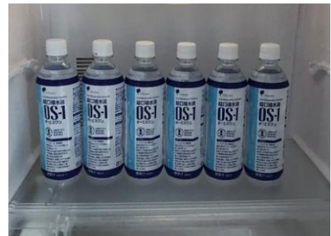
経口補水液等の冷却保管